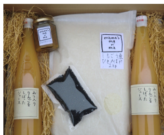
写真は堪能セット