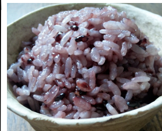
上の写真はイメージです