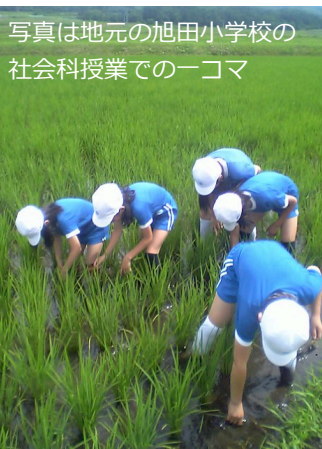
写真は地元の旭田小学校の社会科授業での一コマ

先月23日から始まった田植えも26日には終了し、田んぼの作業ではこれから草との闘いです。稲の生育を妨げる雑草を取り除き、元気に育ててもらいます。最近では投げ入れるだけの簡単な除草剤も出ていますので楽チンですが栽培期間中農薬不使用米”とか米”では機械と道具そして人力を使います。機械はカルチという稲と稲の間をかき混ぜながら草を浮かせるもので、1反で約1時間で終了します。その後、草取りの道具を使って株と株の間の除草をしますが1反で約2日かかります。この草取りの作業が面白いところは雑草が面白いように浮かび上がってくるところです。この草取りの作業はお盆まで続き、3回ほど田んぼに入ります。稲の背丈が大きくなってくると雑草も稲の生育に勝てなくなり、田んぼ